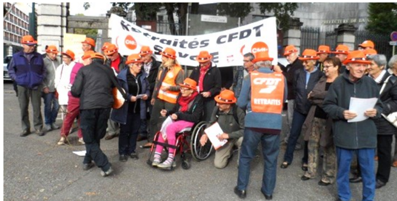
La CFDT devant les grilles de la préfecture

Une quarantaine d'adhérents ont manifesté devant la préfecture à Chambéry