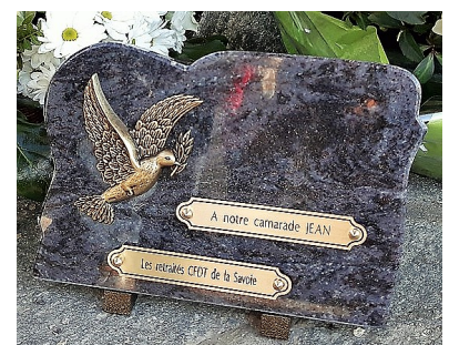
Plaque souvenir de L'UTR Savoie

Tu resteras pour nous un exemple. l'UTR de Savoie ne t'oubliera pas.